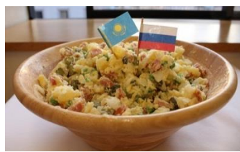
↑ Russia お正月や祝いごとの時は、オリビエサラダとみかんを食べる！昔みかんは高級品だったらしい。